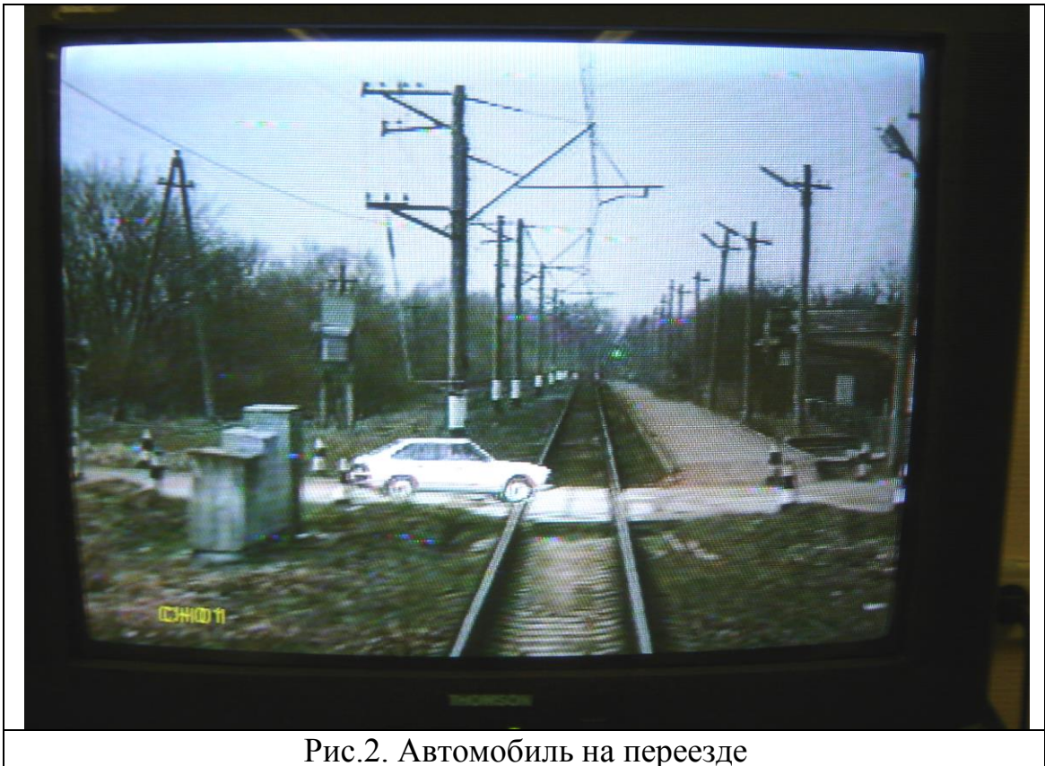
Рис.2. Автомобиль на переезде

Проверка бдительности машиниста предусматривает выполнение операций экстренной остановки поезда, заключающееся в следующих манипуляциях: